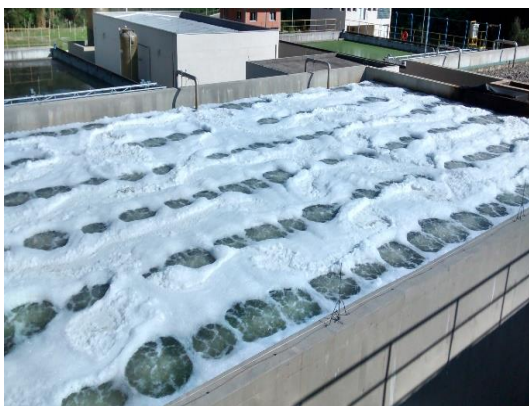
Figura 2: Foto do filtro da ETE Tega com espumas a ser controlada.

Será aceita a formação mínima de espumas, desde que em quantidade que não seja carregada pelo vento. Na figura 2 é apresentada uma situação com nível de espumas a ser controlada, e na figura 3 é apresentada uma situação com o nível de espumas controlada; ambas as situações estão sob regime normal de tratamento com a utilização da aeração forçada de ar.