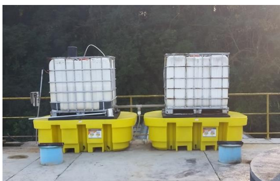
Figura 1: Sistema de dosagem instalado na ETE Pinhal.

A Contratada deverá fornecer 10 (dez) sistemas de dosagem para as 6 (seis) ETE's indicadas – composto por: 2 tanques com capacidade de 1.000L cada, bombas dosadoras com capacidade de dosagem de no máximo 2,5L/h, agitadores eletromecânicos para os tanques, bacias de contenção para os tanques, tubulações e registros. Será permitido que os tanques fiquem sobre os reatores UASB, próximos ao ponto de dosagem, como mostrado na figura 1. Salientando que para as ETE's Tega, Belo, Pena Branca e Pinhal deverão ser fornecidos 2 (dois) sistemas de dosagem em cada, e para as ETE's Samuara e Canyon apenas um sistema em cada.