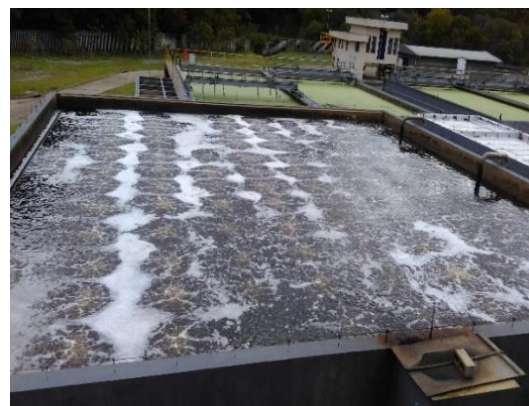
Figura 3: Foto do filtro da ETE Pinhal com espuma controlada.

5.1.5. O transporte do produto deverá obedecer à regulamentação para o transporte rodoviário de produtos químicos Normas Brasileiras e Regulamentos Técnicos do Inmetro em vigor, sem prejuízo do disposto nas normas específicas relativas ao produto.